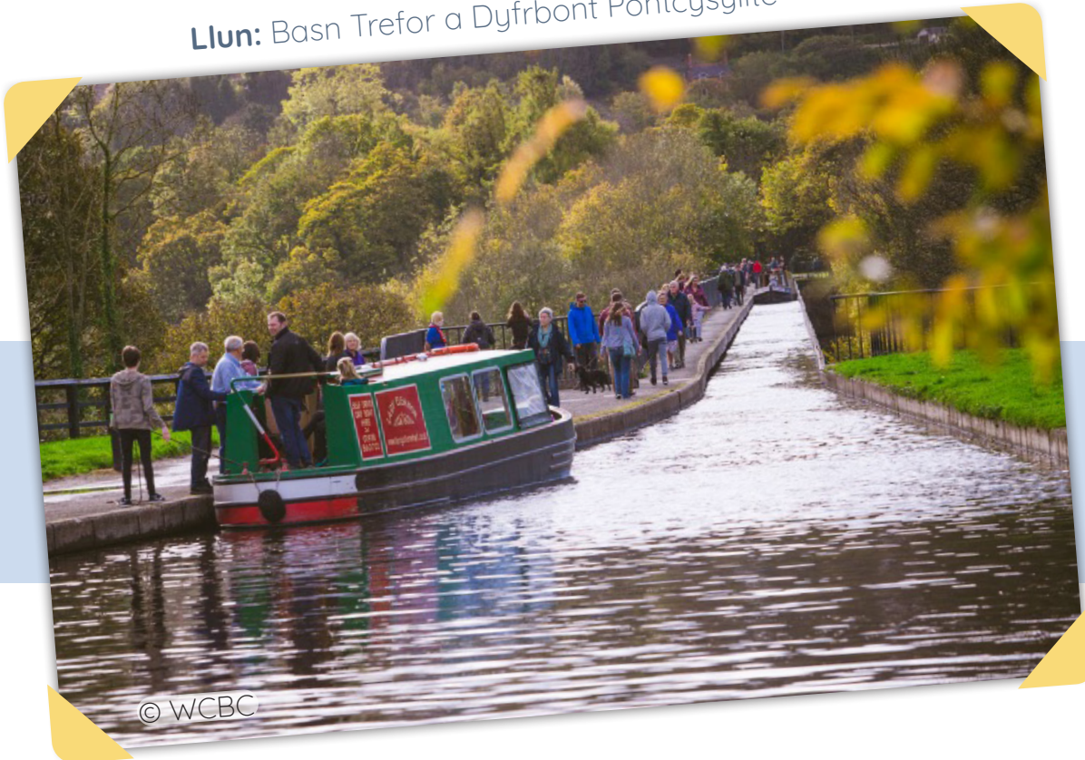
Llun: Basn Trefor a Dyfrbont Pontcysyllte