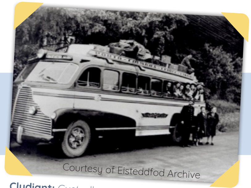
Cludiant: Cystadleuwyr o Bortiwgal yn gadael Eisteddfod Ryngwladol, 1947