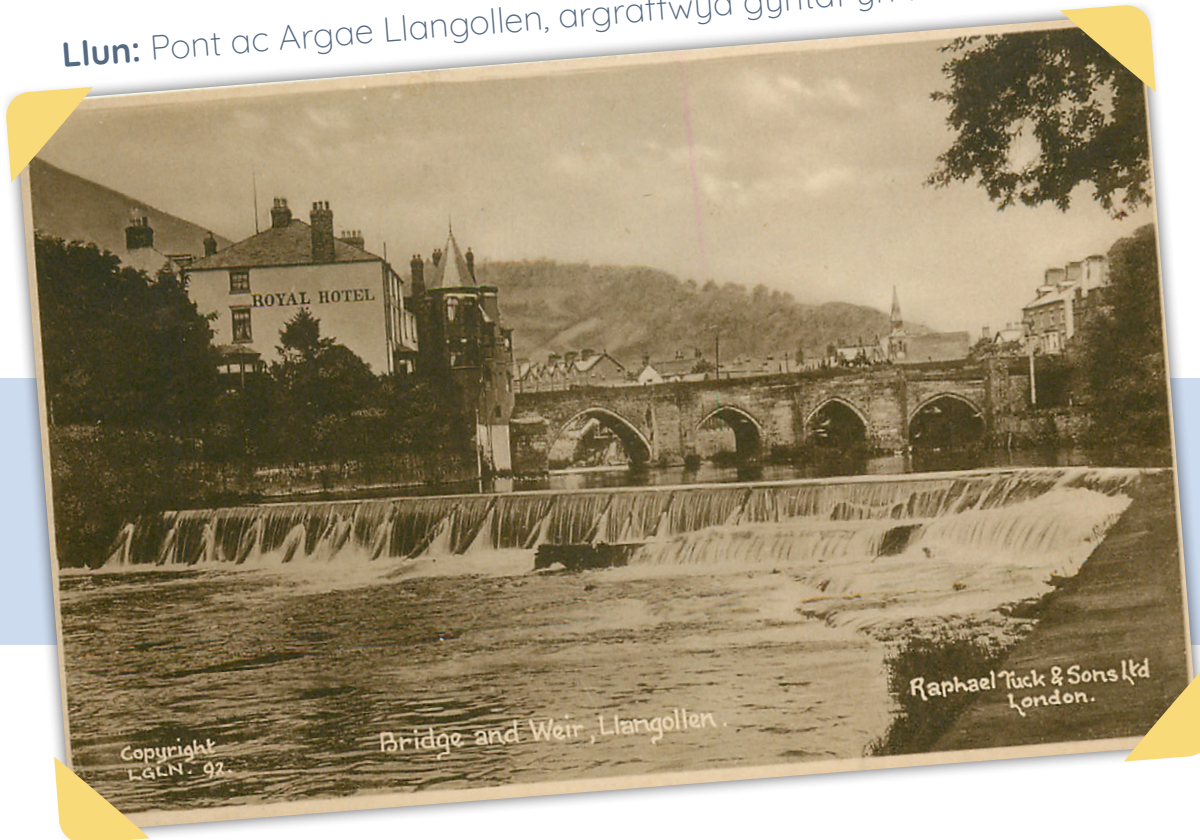
Llun: Pont ac Argae Llangollen, argraffwyd gyntaf yn 1941