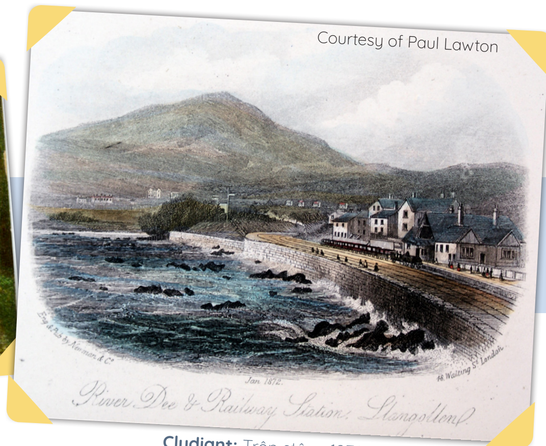
Cludiant: Trên stêm, 1872