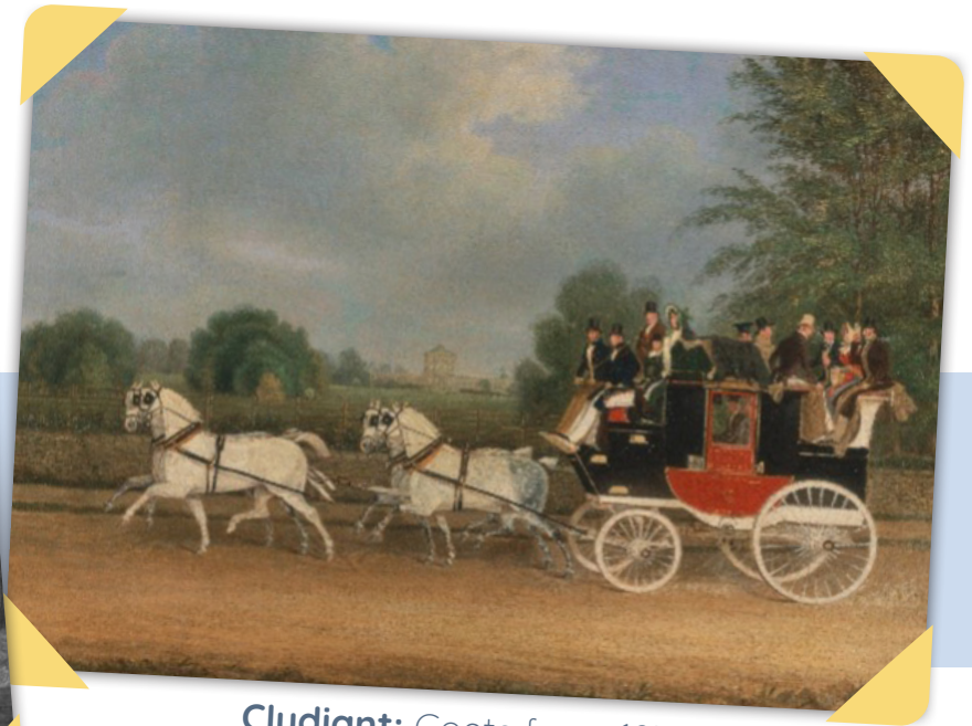
Cludiant: Coets fawr, 1835