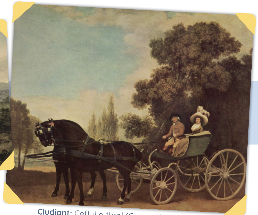
Cludiant: Ceffyl a throl (George Stubbs, 1787)