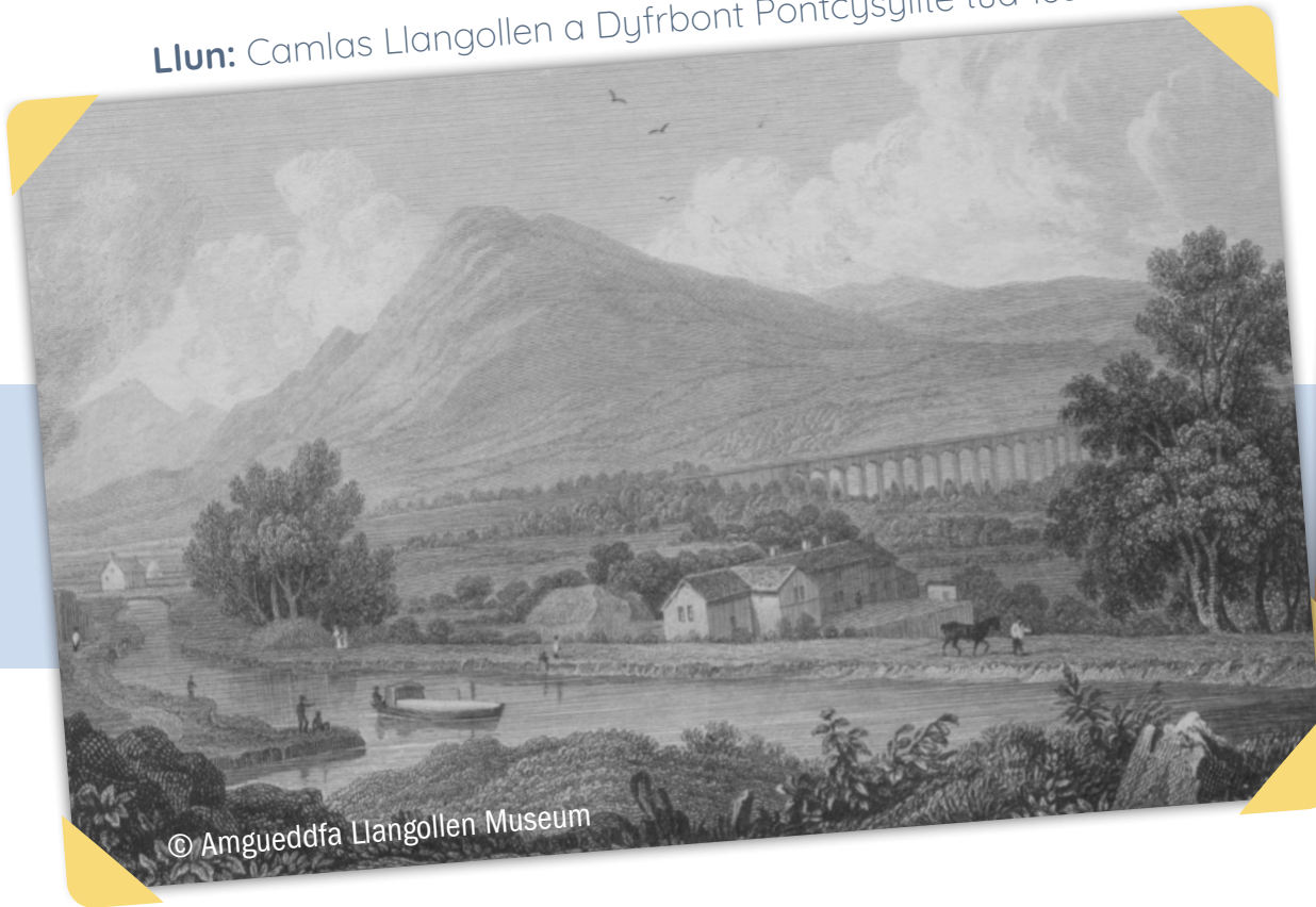
Llun: Camlas Llangollen a Dyfrbont Pontcysyllte tua 1830